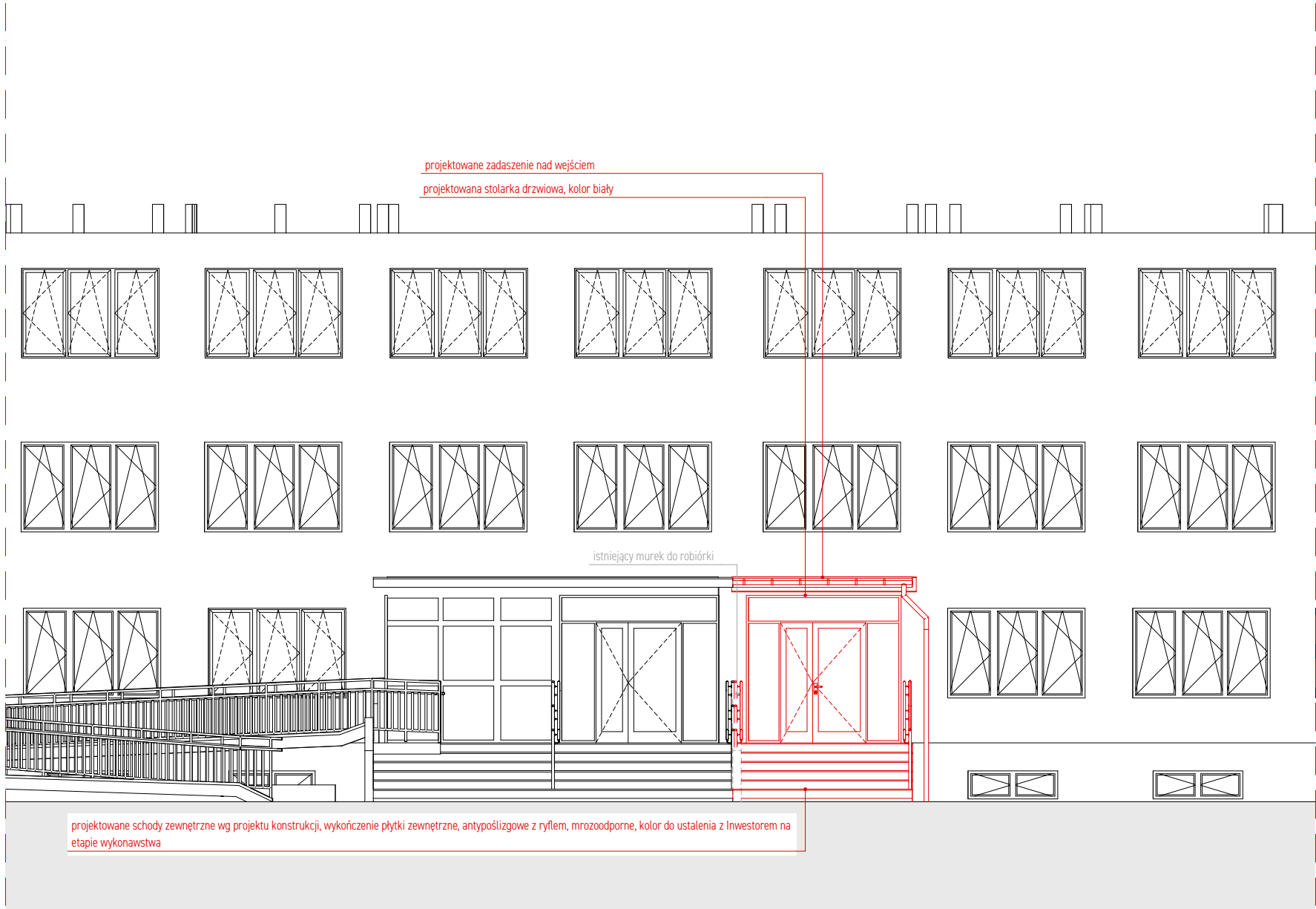
E-03 Fragment elewacji wschodniej- wyjście ze stołówki- segment C 1:100