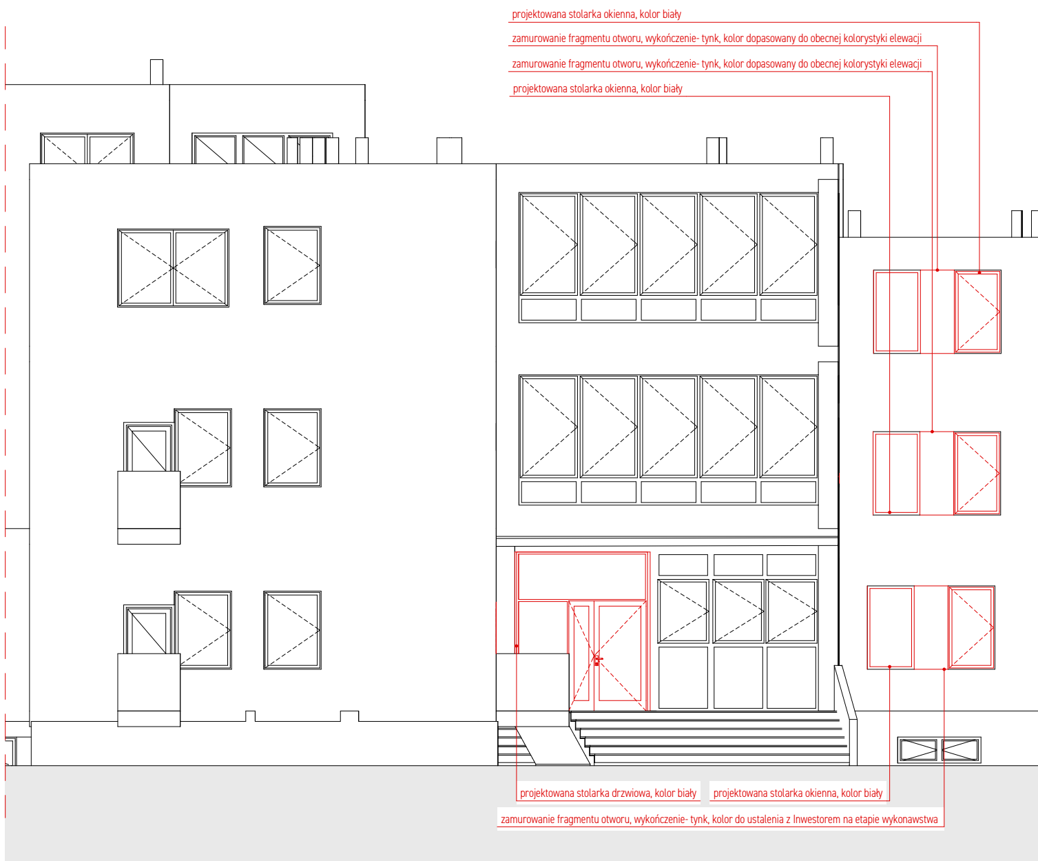
E-03 Fragment elewacji wschodniej, wyjście, segment A 1:100